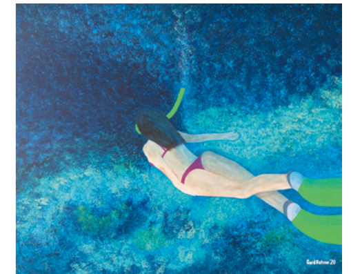
浸溺 壓克力 100 x 120 cm 2020 Submerged, Acrylic on canvas, 100 x 120 cm, 2020

〈一至性 Coherence〉的創作靈感大概是來自格陵蘭島的色彩與質感，畫面中心的綠色代表了植物的活力。而右下角的藍與白則是島嶼周圍的海與冰，在畫面中帶來一種律動感與寧靜。而左上角的色彩更是能帶來寧靜與祥和，會畫的技術與質地改善了畫作了律動中的不同。