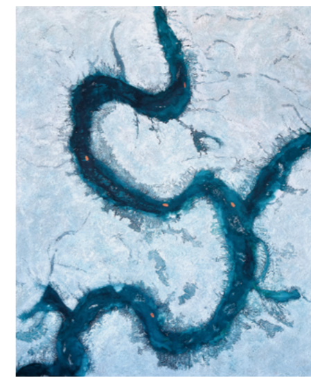
氣候溫和 油畫刀 水墨 壓克力 畫布 120x100 cm 2023 Climate Neutral, palette knife, ink, acrylic on canvas, 120x100 cm, 2023