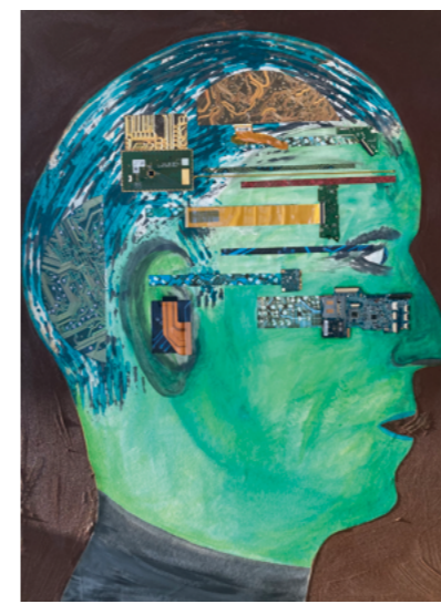
A.I. 鐵鏽 電子零件 壓克力 畫布 80 x 60 cm 2022 A.I., Ironrust, electronic parts, acrylic colour on Canvas, 80 x 60 cm, 2022

最終總結，我願將藝術家Gerd Rehme想作一名有足夠創造力、並勇於探索新領域的航海家。