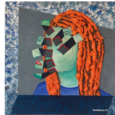
碎片 拼貼畫 泡棉版 壓克力 畫布 100 x 100 cm 2022 Fragments, Collage, construction foam, acrylic colour on canvas, 100 x 100 cm, 2022